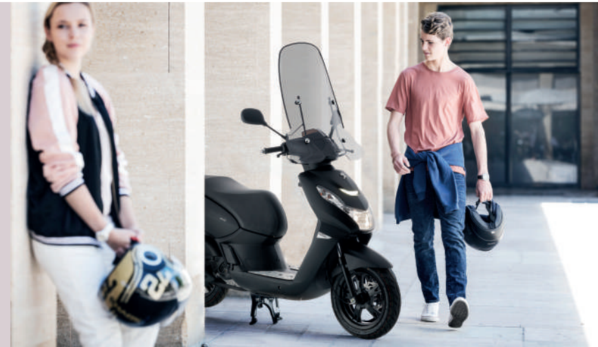
A imagem apresentada contém acessórios opcionais com custo adicional.