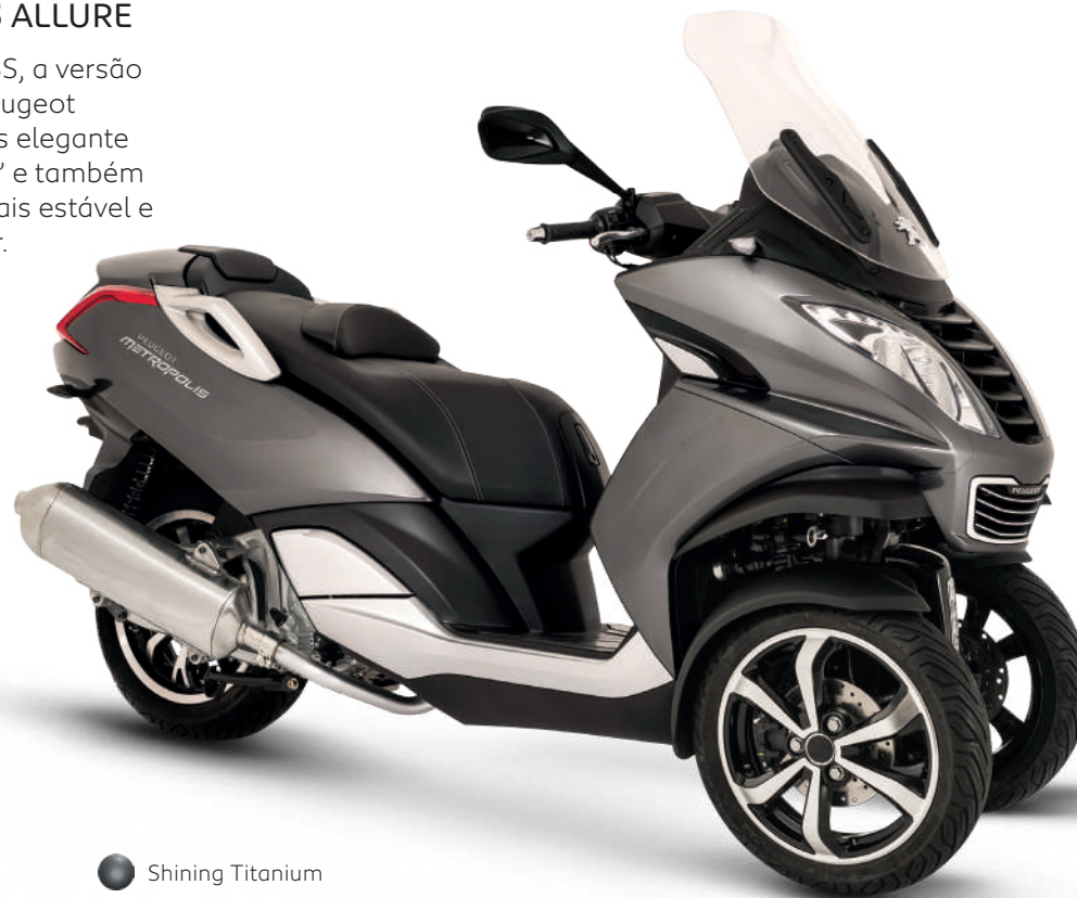
● Shining Titanium

Equipada com ABS, a versão Allure da nova Peugeot Metropolis é mais elegante com jantes de 13" e também é mais segura, mais estável e fácil de manobrar.